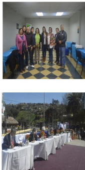
En Busca de los Sabores locales

Esta iniciativa, organizada por la Oficina de Turismo Municipal, que cuenta con la colaboración de la Cámara de Comercio Detallista y Turismo de San Antonio y la Agrupación Chef del Mar, busca poner en valor el Turismo Gastronómico local