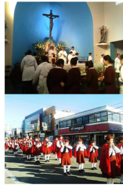
San Antonio de Padua, la Comuna rinde homenaje a nuestro Patrono San Antonio - Junio 2015