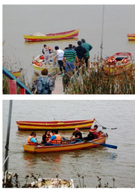
Tradición Ancestral, Festividad del Chinchorro