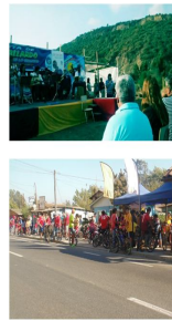
Tierra de Brujos y leyendas El Embrujo de lo Gallardo.