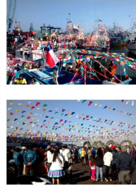
SAN PEDRO PESCADOR SAN ANTONIO - JUNIO 2015

Rescatando raíces e identidad local , la oficina de turismo fortalece un nuevo año de tradición