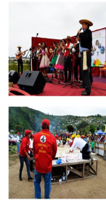
La Gran Tortilla Al Rescoldo.