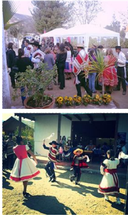
Romería a San Isidro, patrono de las lluvias y buenas cosechas Cuzcutumén - Mayo 2015